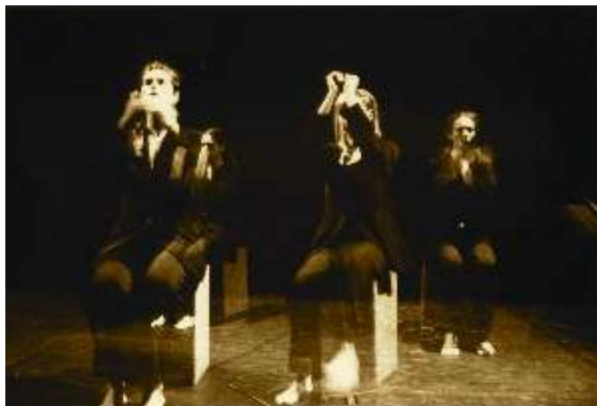
Figure Sonore è il titolo di un breve concerto di partiture gestuali.

Il movimenti sono costruiti su ritmi ripetitivi molto semplici, evocativi di stati d'animo, come sono le canzoni, come erano le antiche forme di narrazione cantata.